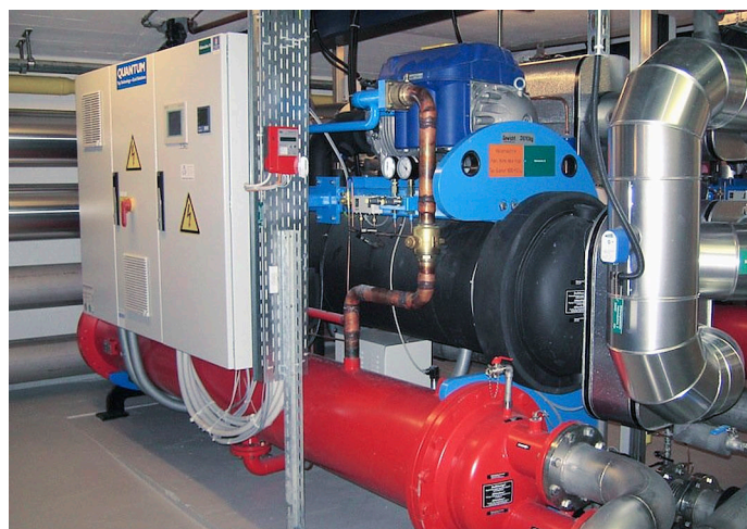
Neuanlage Waidspital Zürich mit zwei wassergekühlten Quantum-Kältemaschinen zu je 600 kW.

Kopp weist weiter darauf hin, dass die 3-K vor rund sieben Jah-