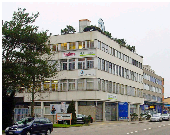
Der Firmensitz der Klima Kälte Kopp AG an der Silberstrasse 12 in Dietikon ZH.

Der garantierte, optimale Support für die ohne Unterbruch im Einsatz stehenden Anlagekomponenten rund um die Uhr ist eine weitere Dienstleistung, welche die 3-K auszeichnet. Damit dieser Support trotz des umfangreichen und technisch anspruchsvollen Produktesortiments reibungslos funktioniert, bilden sich die Mitarbeiter der technischen Abteilung ständig