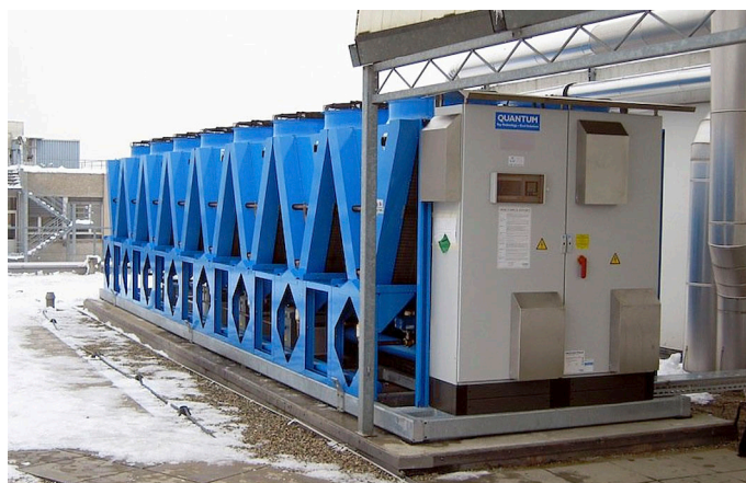
Diese luftgekühlte Quantum-Kältemaschine in Nyon erbringt eine Gesamtleistung von 800 kW.

Dem Firmenchef liegt viel an der Förderung der menschlichen und fachlichen Kompetenzen seiner Mitarbeiterinnen und Mitarbeiter. «Dies geschieht mit permanenten Schulungen und Trainings, aber auch zielgerichtet in der Praxis während der täglichen Arbeit», sagt Kopp und betont: «Das Umweltbewusstsein ist ein fester Unternehmensbestandteil bei all unseren Aktivitäten. Es bestimmt diese stets entscheidend mit. Eines unserer Ziele ist beispielsweise die Zusammenarbeit mit Partnern, die sich die Erreichung einer optimalen Energieeffizienz zum Ziel gesetzt haben.» Gegenwärtig beschäftigt die 3-K 20 Mitarbeitende. Die meisten von ihnen werden an ihrem Sitz an der Silberstrasse 12 in Dieti-