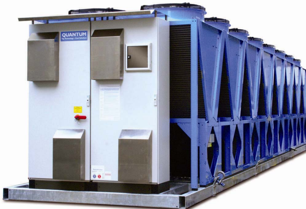
Abbildung: Luftgekühlter QUANTUM mit 16 Ventilatoren

Der QUANTUM ist in vielen Varianten lieferbar. Unsere Ingenieure führen nicht nur Wirtschaftlichkeitsberechnungen durch, sondern wählen nach Ortsbegehung und Analyse der Anforderungen ein auf Sie zugeschnittenes QUANTUM-Modell aus.